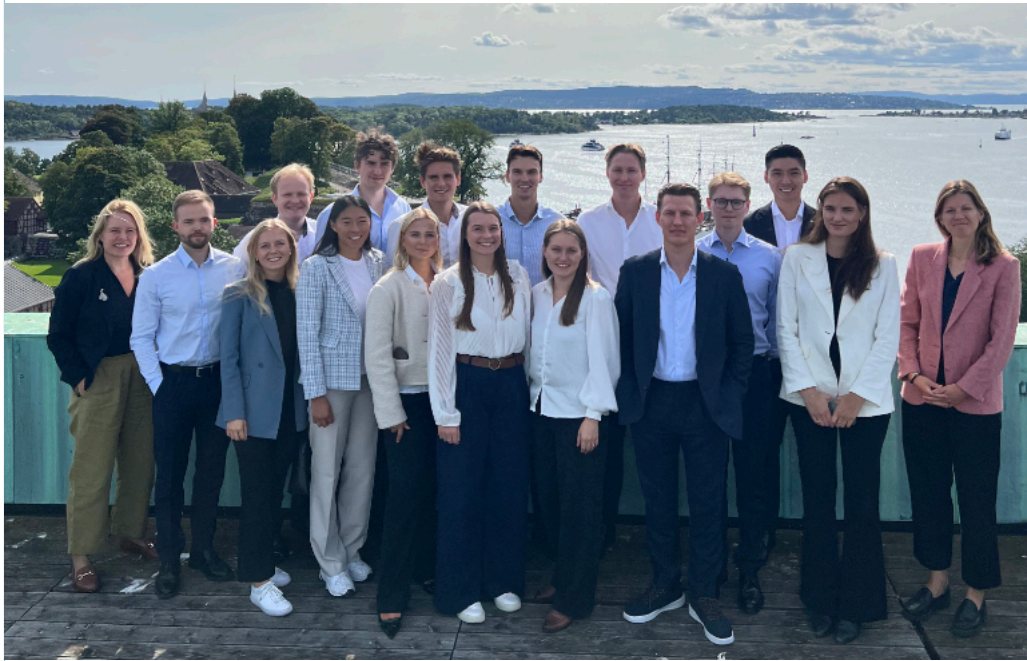
KULL 16 MARITIME TRAINEE.